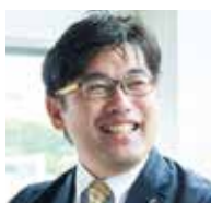
株式会社九州永田 代表取締役

会社設立：1952年 / 正社員数：45名 / パート・アルバイト数：6名 / 実習生：4名 / 資本金：1,000万円 / 年商：10億円 / 事業内容：トラックから軽自動車までの整備・販売、保険代理店業 ホームページ URL https://lotasmatsuo.com/company/