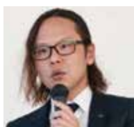
(株)マツオ HDC / (株)C・L・S 代表取締役社長