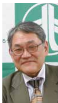
慶應義塾大学 経済学部教授

国内外情勢の多層的、複合的危機によって緊張感が高まる中、反発するように平和を希求する声も強まっています。中小企業は地域社会の主役として、経済的な側面だけでなく雇用や教育、歴史や文化といった地域に暮らす人々の安心・安全な生活環境を支えてきました。持続可能な社会を支える中小企業存続のために、情勢をどのように捉え、どのような経営戦略、企業変革が求められているかを読み解き深めます。