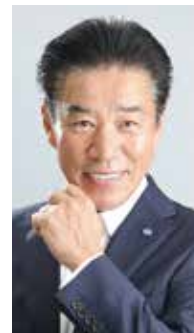
株式会社イーエスプランニング 代表取締役

『我流の知識で継続できるほど経営は甘くない。経営を学びたい』と創業2年目に同友会に入会。阪神・淡路大震災による外部環境の変化に対して、『建築』から『管理・運営』に業態を転換することで対応。積極的に行政施策にも取り組み、これまでに24の認証を取得。今日の活動と理念の一气通貫を目指し経営指針に取り組んでいます。試行錯誤の連続ながら少しずつ進化している状況を報告します。