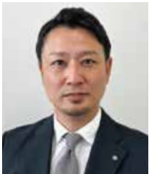
中小企業家同友会全国協議会 第56回 定時総会実行委員長