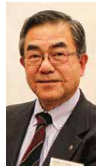
株式会社ヒロハマ 取締役会長

「失われた30年」と呼ばれる日本経済の停滞の中、同友会運動は本年度過去最高会勢を突破し発展してきています。「自助努力」「経営者の責任」「人間尊重」に裏付けされた「同友会理念」の先見性と普遍性が私たちを支え、発展に導いています。広浜氏の自主・民主・連帯の精神を体現し、21世紀型企业づくりを通して「自他を決しておとしめないこと」「すべての人がその素晴らしさを発揮できる社会を作ること」を目指した実践に学びあいます。