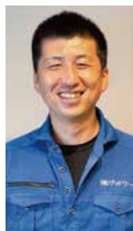
株式会社グッドワーク 代表取締役

香川県三木町の未来を懐疑的に見つめどこか他人事だった報告者。振興条例や地元高校との「共育型インターンシップ」の取り組みで自社の課題＝地域の課題だと認識し、熱い想いを持って三木支部を設立します。地域、企業を変える為に明確な支部の使命・ビジョンを持って同友会運動を進め、そこに共感・賛同する多くの仲間と共に「地域の未来を変えるのはオレたちだ」と一人一人が小さな光を放ち、地上の星へと成長し続ける体験報告です。