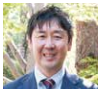
クラシオ株式会社 代表取締役社長