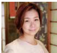
(有)オールゲット / (株)F.A.G 取締役社長

会社設立：1953年 / 正社員数：16名 / パート・アルバイト数：1名 / 資本金：300万円 / 年商：2億円 / 事業内容：戸建木造住宅の総合メンテナンス ホームページ URL https://kurashio.co.jp/