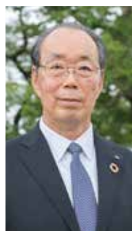
藤田建設工業株式会社 取締役会長

地域企業の永續には、地域に感謝し、地域を大切に、地域への責任をしっかりと実行していくことが大切と考えています。1社では小さな存在も、2社、3社と手を合わせると大きな結果へと繋げていけます。藤田建設工業株式会社では、多種多様な関連グループ企業が、同友会で共に学び協力することで、1つの会社ではできないことを成し遂げ、次へのチャンスに変えるとともに、地域貢献と繋がる仕組みづくりを実施しています。