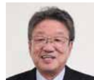
有希化学株式会社

同友会のご真ん中で活躍し続けながら事業を成長させた豪腕社長とそれを承継した三代目新社長。カッコいい成功例や華々しく変革した話ではなく、「経営と同友会は不離一体」と、自己変革(脱・ワンマン社長/脱・同友会ごっこ)と経営指針の実践に取り組み、ひたすら愚直にやり続けてきた中で変化し進化し続けたこと、そして深化させてきたもの。本当に引き継ぐべき大切なものは何か?そして向かう次のステージはどこか?親子リレー報告とクロストークで本質に迫ります!