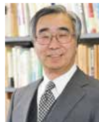
特定非営利活動法人アジア中小企業協力機構 理事長

会社創業：1970年 会社設立：1977年 正社員数：37名/パート・アルバイト数：5名 資本金：4,800万円 年商：4億6,000万円 事業内容：リースキン事業、ハウスクエア事業、 トータルコーティング事業など ホームページURL https://kireimaru.jimdo.com/